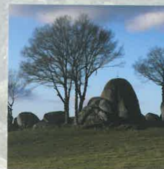
Rocher de la Clouque